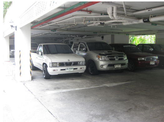
ภาพที่ 2-2 ที่จอดรถของพื้นที่โครงการ